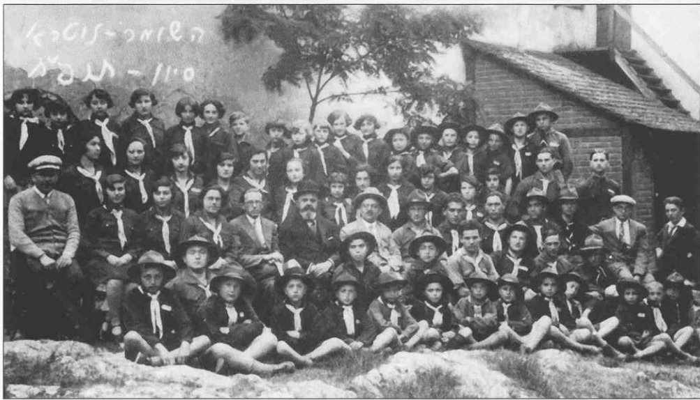
Židovskí skauti z Nitry, 20. roky 20. storočia.

I 190 židov dočasne chránených výnimkami, asi 180 konvertitov a niekoľko osôb s falošnými árijskými dokladmi.