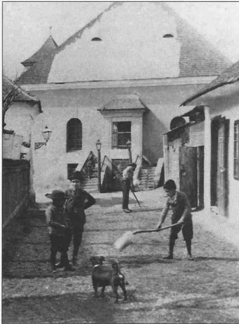
Na dvore synagógy, 20. roky 20. storočia.

predmety. Stoličné úrady nariadili miestnym orgánom ich trestné stíhanie. Aj v tom období bol pobyt židov v centre mesta zakázaný. Židovské rodiny bývali na predmestí v Párovciach, ktoré sa považovali za židovskú osadu.