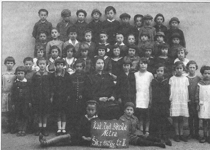
Židovská ľudová škola v Nitre v rokoch 1925–1926.